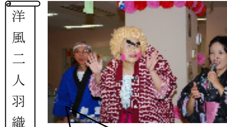
洋 風 二 人 羽 織