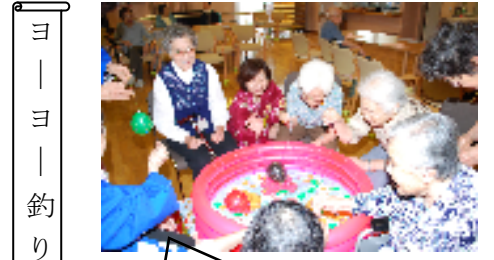
ヨ ー ヨ ー 釣 り